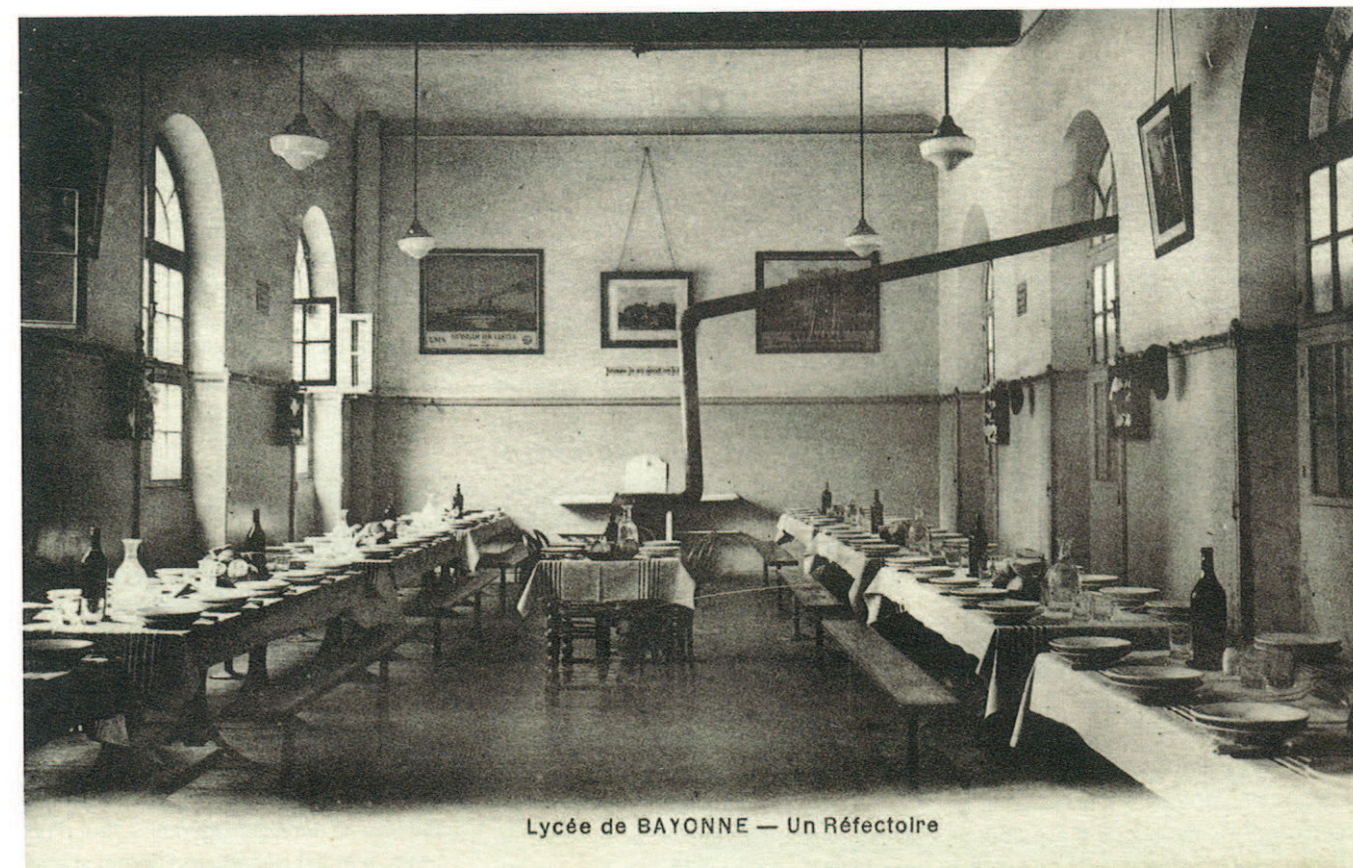
Lycée de BAYONNE — Un Réfectoire

effectifs ; d'autre part, désenclaver le bâtiment, prisonnier de ses murs d'enceinte d'un autre temps, pour offrir son architecture unique au regard de la ville. Un autre de ces défis aura constitué en la réalisation d'un tel chantier de restructuration en site occupé par les membres de la communauté éducative, dans un souci permanent de sécurité des élèves, obsession dont la trace n'est absente d'aucun des 150 comptes-rendus de chantier.