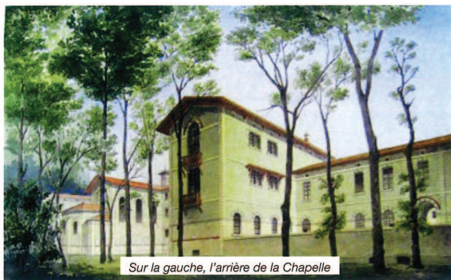
Sur la gauche, l'arrière de la Chapelle