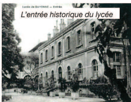
L'entrée historique du lycée