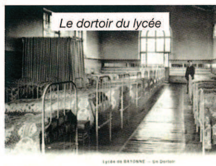
Le dortoir du lycée