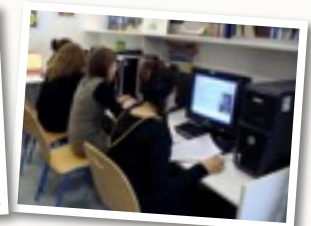
L'informatique en classe