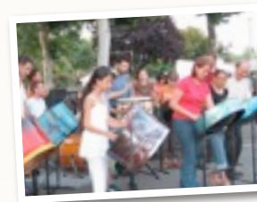
L'orchestre de Steel-drum-

Depuis plus de 20 ans la musique fait partie des priorités de ce collège et tous les élèves peuvent, en dehors du cours hebdomadaire, participer activement à la chorale (80 élèves) et/ou à l'orchestre de steel-drums (30 élèves). Pour les plus motivés il existe l'atelier de pratiques artistiques musique (à partir de la 4 ème ), la C.H.A.M. de la 6 ème à la 3 ème (voir page spéciale sur ce document), ou l'atelier création de chansons .