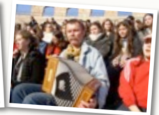
Voyage en Italie