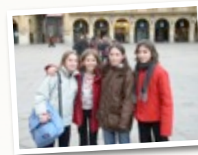
Voyage en Espagne