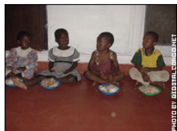
LE TAUX DE MALNUTRITION GLOBALE PARMI LES ENFANTS DE MOINS DE 5 ANS UR DE 10 A 20%

Des organismes humanitaires tels que FAO (état de l'insécurité alimentaire dans le monde), OMS (organisme mondial de la santé) et l'UNICEF (organisation nationale pour les enfants) fournissent à ces pays les médicaments nécessaires pour soigner les populations atteintes. Mais elles ne se rendent pas au dispensaire pour prendre ces médicaments.