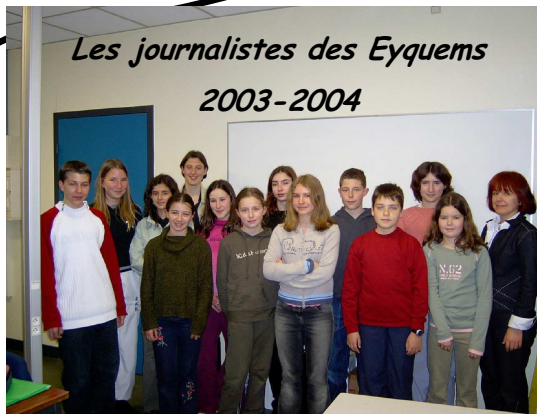
Les journalistes des Eyquems 2003-2004