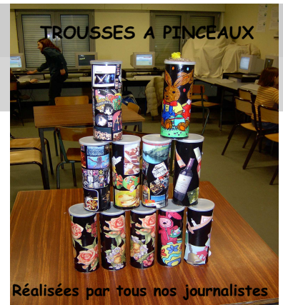
Réalisées par tous nos journalistes

Chercher des images ou des photos dans des magazines qui permettent