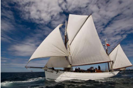
Le cotre Mutin, à la mer.

Le 7 mai dernier, une classe de seconde de notre lycée a reçu l'autorisation de faire une visite à bord d'un bâtiment de la Marine nationale, le Mutin , qui faisait escale à quelques encablures de la rue Dunant.