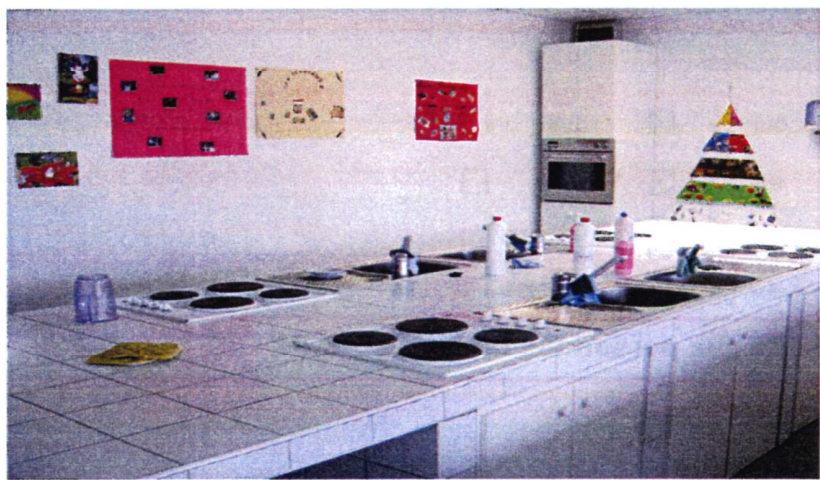
5 photos internes aux locaux du site : 1 Salle de formation / 1 plateau technique petite enfance / 1 plateau technique alimentation