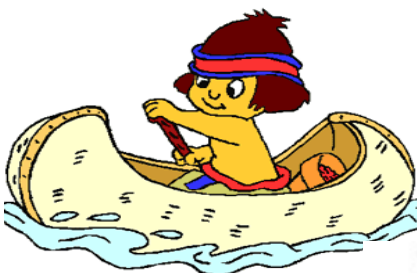
Sortie plein-air à Rouffiac