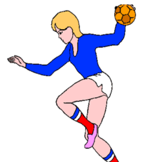
Football- hand-ball-rugby basket-ball-volley-ball