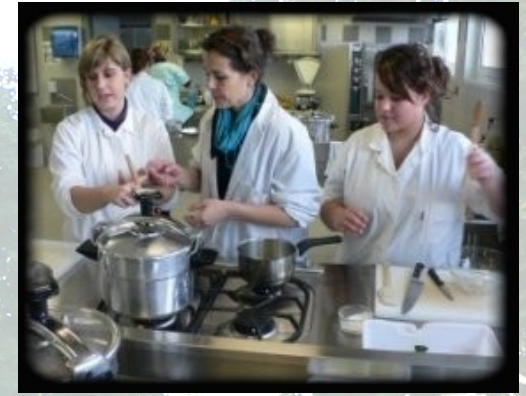
Mention Complémentaire Aide à Domicile (MCAD)