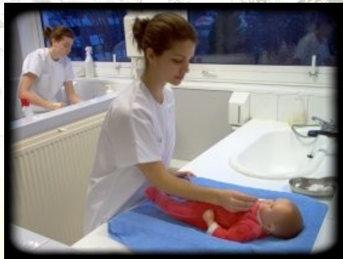
Bac pro ASSP (Accompagnement Soins et services à la personne)