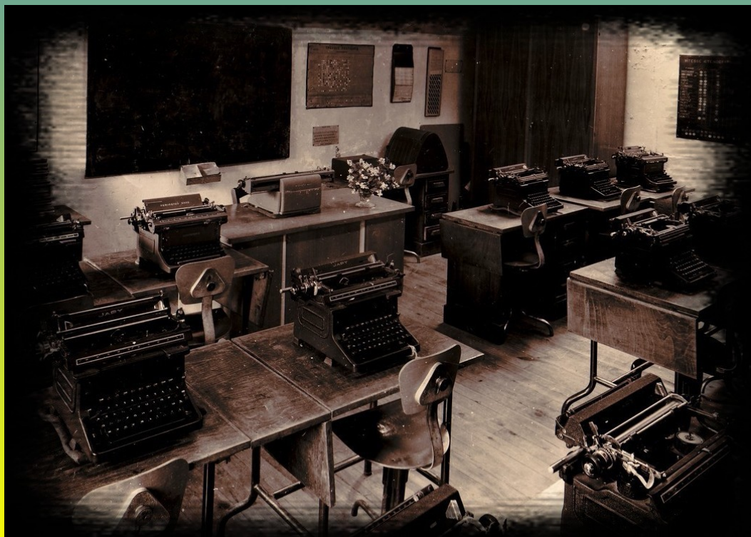
Salle de cours des secrétaires