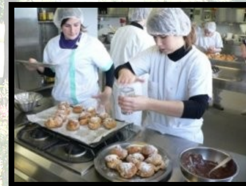
Assistant Technique en Milieux Familial et Collectif (ATMFC)