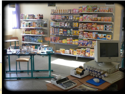
Bac Pro Commerce (3 ans)