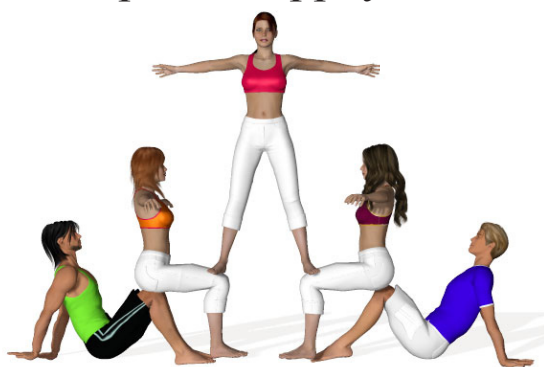
Pyramides à 5/6

Pour imprimer, appuyez sur le bouton bleu «imprimer»