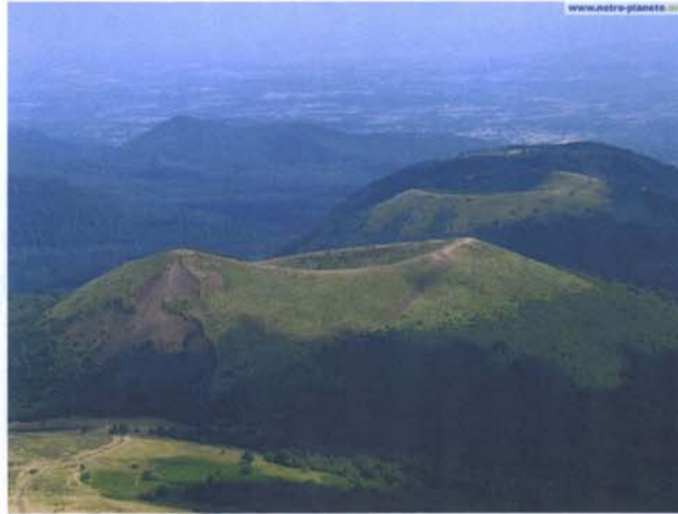
Le Puy de Dôme, dans la région de l'Auvergne.