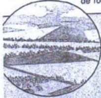
Monts d'Arree 384 m

Plaines et plateaux se caractérisent par un relief général plat. Ils occupent surtout l'ouest et le nord du pays. Ils sont souvent parcourus par des fleuves, et la circulation y est facile. Ce sont des régions de forte activité agricole.