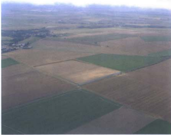
Le village de Boudvin, dans la région de la Beauce.