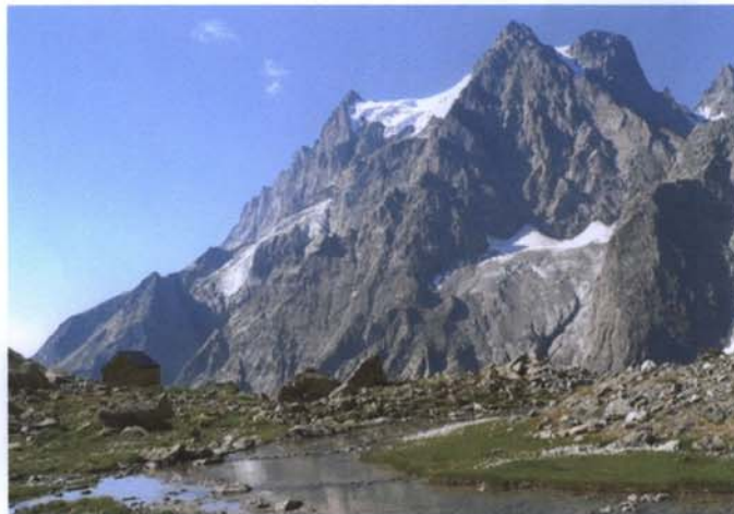
Le Pelvoux, dans le massif des Ecrins, dans la région de l'Isère.