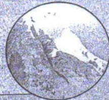
Monte Cinto 2710 m

Les montagnes jeunes sont les reliefs les plus récents. Les sommets sont élevés et pointus, les pentes vigoureuses et les dénivellations importantes. Les Alpes et les Pyrénées sont les massifs les plus élevés. À 2 500 m commence la haute montagne, avec de magnifiques paysages de rochers et de glace. Le plus haut sommet d'Europe se trouve dans les Alpes, c'est le mont Blanc.