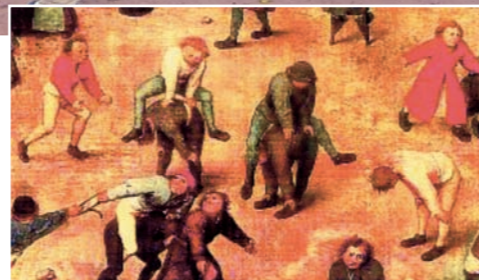
Les jeux d'enfants, P. Bruegel, Kunsthistorisches Museum Wien ©