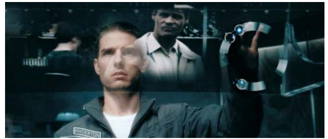
Tom Cruise dans Minority Report