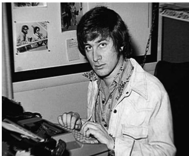
Steven Spielberg au travail à Universal (1971)

d'un garçon et d'une fille qui font du stop. Le film sera sélectionné et primé dans de nombreux festivals. Et permettra à Spielberg de se voir offrir un contrat par les studios Universal, qui l'embaucheront pour leur département télévision.