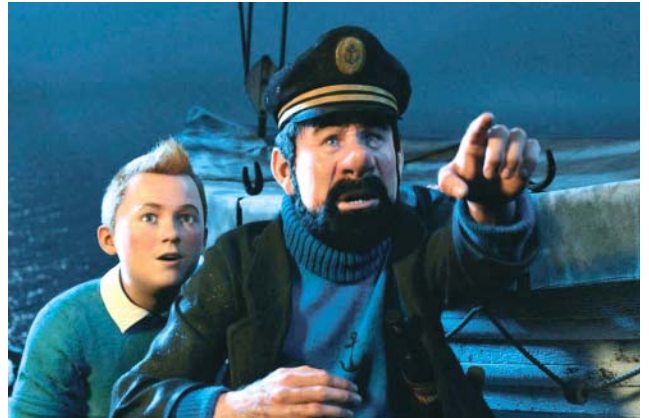
Les Aventures de Tintin