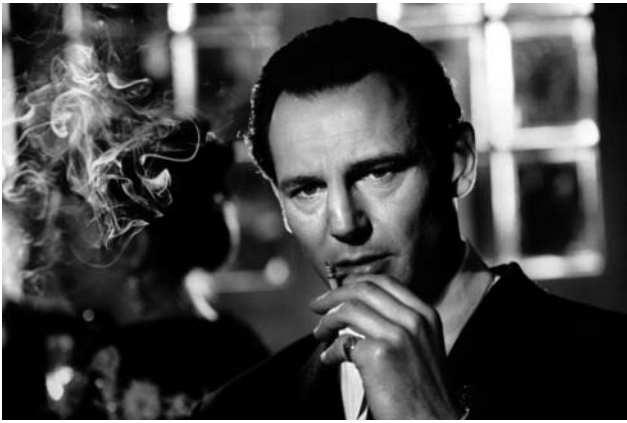
Liam Neeson dans La Liste de Schindler