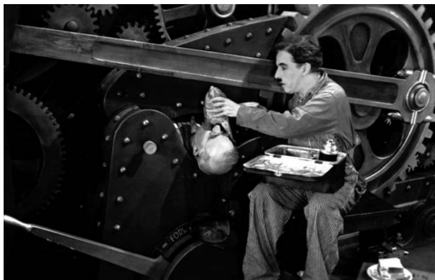
Les Temps modernes