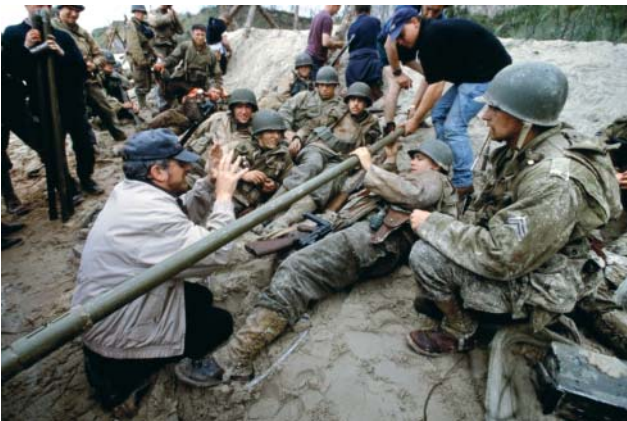
Il faut sauver le soldat Ryan - Steven Spielberg dirige Tom Hanks

faisait peur : l'obscurité, le tonnerre, les éclairs... J'ai toujours détesté les meubles Louis XV car ils avaient des pieds et j'étais terrifié à l'idée que, la nuit venue, ils se mettent à marcher et viennent dans ma chambre. De même, j'adorais me regarder fixement pendant des heures dans les miroirs jusqu'à ce que je ne sache plus qui j'étais, et je parlais de la pièce terrifiée, en courant 4 . » Une autre cause d'isolement le frappe : « J'ai été victime de l'antisémitisme dans ma jeunesse. Je n'ai jamais avoué ma judéité. J'allais même jusqu'à la nier. Au lycée, des élèves me frappaient en me traitant de "sale juif". Ma dernière année de lycée a été la pire de toute mon existence. Une part de mon désir de réaliser La Liste de Schindler est venue de ma propre expérience de l'antisémitisme 5 . » Le cinéma, dès lors, devient une source d'évasion idéale. Cette passion révèle rapidement un esprit d'entrepreneur et une envie de création concrète : pas encore adolescent, Steven Spielberg a déjà acquis la certitude qu'il fera des films (cf. « Enfant cinéaste », p. 5).