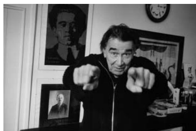
Armand Gatti.

Jean-Pierre (né le 21 avril 1951) et Luc (né le 10 mars 1954) Dardenne ne viennent pas du sérail cinématographique. Ils passent leur enfance et leur adolescence à Engis (où est né Jean-Pierre), commune industrielle située au bord de la Meuse, à une vingtaine de kilomètres de Liège. Engis vit de carrières et de fours à chaux, de la chimie, dans un bassin minier où de nombreuses usines utilisent le charbon (Cockerill à Seraing, proche d'Engis). En décembre 1930, une célèbre catastrophe écologique y a mis pour la première fois en évidence le rôle de la pollution de l'air dans nombre de maladies et décès. Les enfants jouent sur un crassier à gypse tout blanc ou sur les berges de la Meuse.