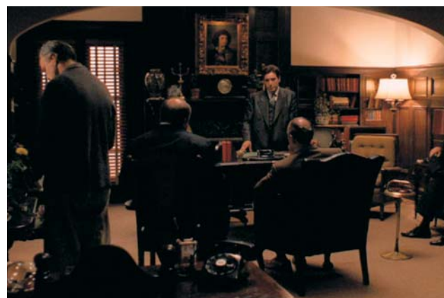
Le Parrain, de Francis F. Coppola.