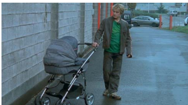
Jérémie Renier dans L'Enfant .

Même si Luc Dardenne a consigné récemment ses réflexions philosophiques dans un ouvrage ( Sur l'affaire humaine , Seuil, 2012), le cinéma des frères Dardenne a toujours su échapper à la pesanteur du sens, du message, incarnant ces interrogations dans une mise en scène charnelle, matérielle, au point qu'on leur reproche souvent leur « naturalisme ». Leur ambition est pourtant seulement d'« arriver à reconstruire de l'expérience humaine. » ( Au dos de nos images , 19/12/1991). Non pas construire les conditions d'une expérience (c'est le naturalisme au sens premier), mais reconstruire : à partir d'un fait divers, de l'observation, de ce que l'on a vécu, de ce que l'acteur, l'actrice puise au fond de soi. Non pas reconstruire une expérience qui a déjà eu lieu, mais créer l'expérience humaine unique dont la caméra va saisir le surgissement.