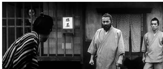
Toshiro Mifune dans Barberousse , d'Akira Kurosawa.