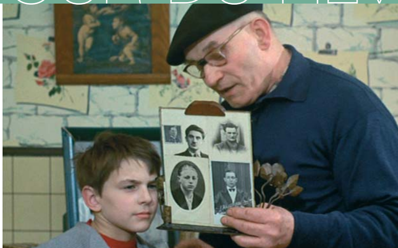
L'Enfance nue , de M. Pialat.