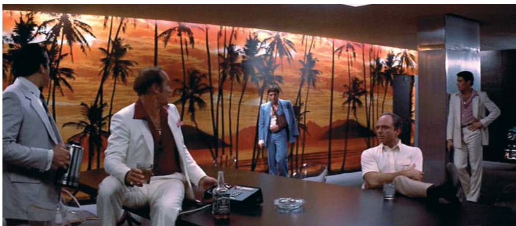
Scarface, de Brian DePalma.