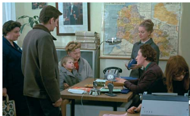
Le placement des enfants ( L'Enfance nue ).