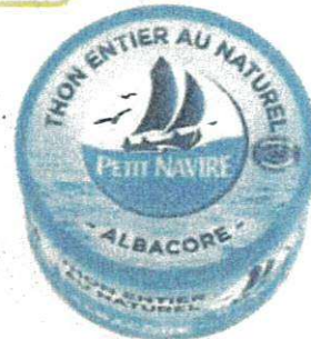
Conserve de Thon