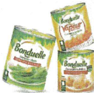
Conserves de légumes