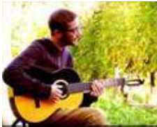
Olosolo se produira en première partie du ciné-concert.

Pour sa réouverture ce lundi 22 juin, le cinéma La Bobine propose un clin d'œil à la Fête de la musique avec un ciné-concert et les compositions du talentueux Olosolo (alias Julien Peruilhe), qui se produira à 21h avant la projection du film « Yesterday » de Danny Boyle, en hommage aux Beatles.