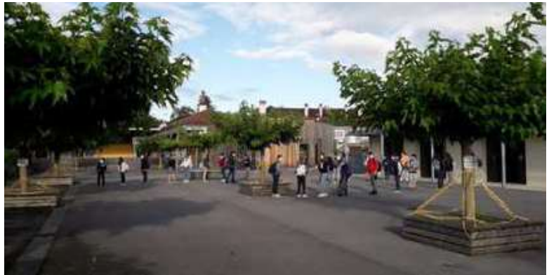
Au collège, les espaces ont été balisés et les gestes barrières sont rigoureusement appliqués.

Au 8 juin, 70 % des élèves avaient repris le chemin du collège. Avant de redevenir obligatoires pour tous à compter de ce lundi 22 juin, les cours ont été dispensés par groupes de 15, une semaine sur deux.