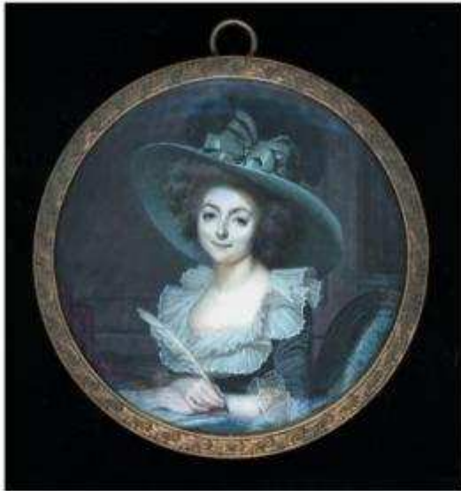
Autoportrait, Sophie, vers