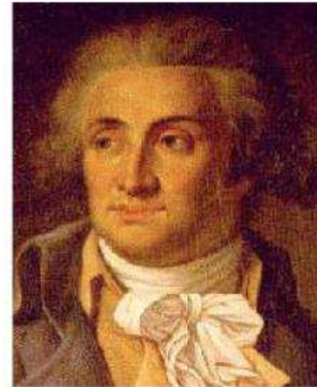
Anonyme, Condorcet, vers 1780