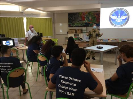
La premier maître Maud du groupement aéronautique militaire de Faa'a a rencontré la CDSG du collège Henri Hiro de Faa'a et a présenté les forces armées en Polynésie française.