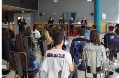
Des femmes civiles et militaires du groupement de soutien de la base de défense de Pau-Bayonne ont rencontré la CDSG de 1 re « sciences et technologies de management et de la gestion » du lycée Jules Supervielle d'Oloron.