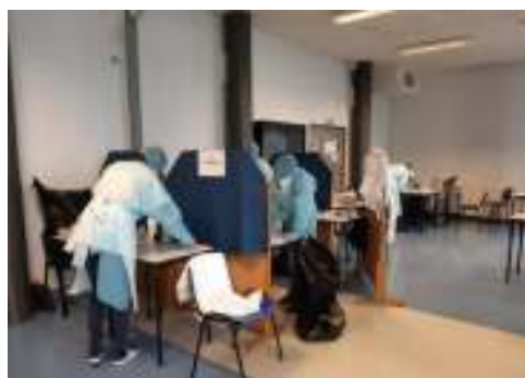
Salle Calipso aménagée en salle de test