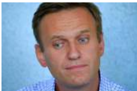
Alexeï Navalny/ Paris Match

Histoire vraie digne d'un film : Alexeï Navalny, l'homme qui sourit