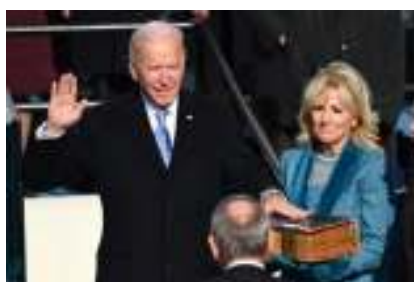
Joe Biden et son épouse Jill Biden le jour de l'investiture

L'investiture du 46 e président des Etats-