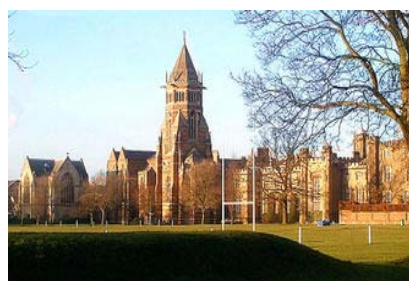
Collège de Rugby

Les origines du rugby sont sans doute plus lointaines.