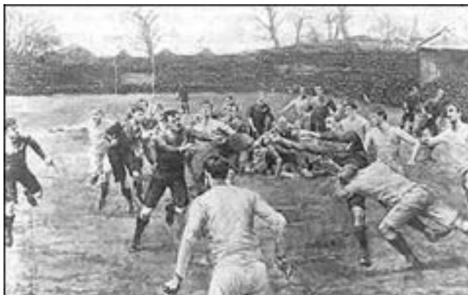
Les premiers matches de Rugby

(Dans le même temps une loi interdit le travail des enfants de moins de 9 ans et limite les horaires à 48 heures par semaine pour les jeunes de 9 à 13 ans et à 69 heures pour ceux de 13 à 18 ans ! On comprend que les ouvriers ne fassent pas de sport après de telles semaines de travail et que le rugby soit resté longtemps le privilège d'une catégorie de personnes).