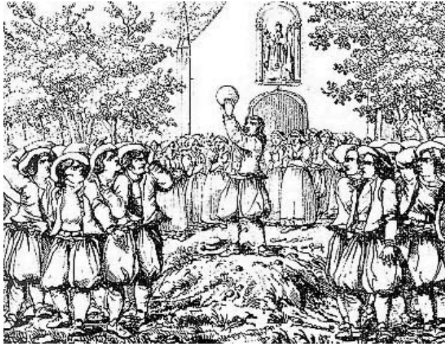
A l'époque de la Soule, village contre village.

Tous ces jeux évoluèrent en Angleterre jusqu'au début du XIXe siècle, date à laquelle le rugby prit naissance dans les collèges anglais qui formaient les jeunes gens issus de la haute société.