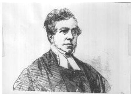
William Webb Ellis

La légende veut que le Rugby ait pris naissance au Collège de Rugby (Angleterre), ce jour de Novembre 1823 où un élève du nom de William Webb Ellis se mit à courir avec le ballon dans ses bras, au cours d'une partie de Football.