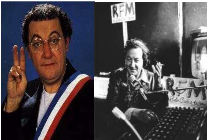
Coluche candidat à l'élection présidentielle en 1981 – Coluche a la radio en 1978.

Coluche commence à travailler à l'âge de 15 ans. En 1968 il devient chanteur ambulant .Plus tard avec des copains ils fondent la troupe " Le chic parisien ". A partir de 1974 Coluche réalise ses premiers spectacles solo et à la radio avec ses sketches tels que " C'est l'histoire d'un mec " et " le Schmilblick ". En 1981 il se porte candidat pour l'élection présidentielle.