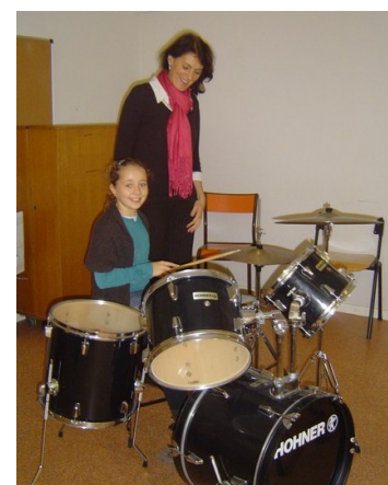
La batteuse du groupe SMILE