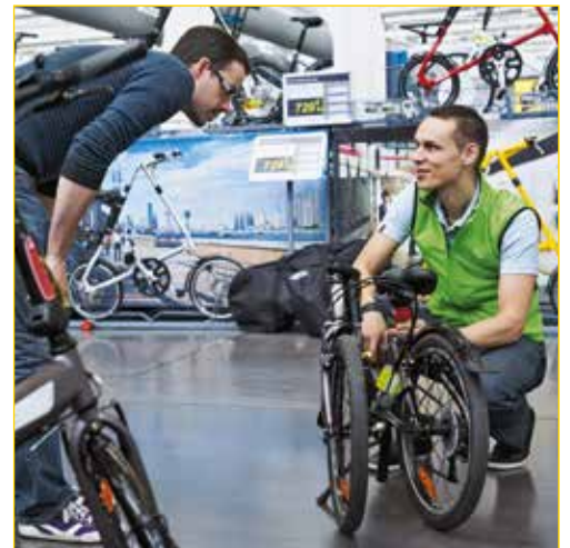
Vendeur d'articles de sport