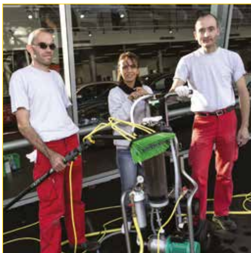
Agents de propreté en équipe

CAP Vendeur-magasinier en pièces de rechange et équipements automobiles