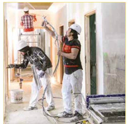
Peintres en bâtiment