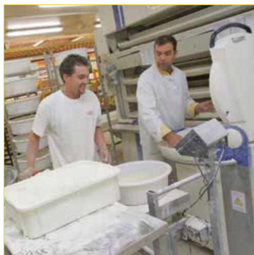
Boulangers en supermarché