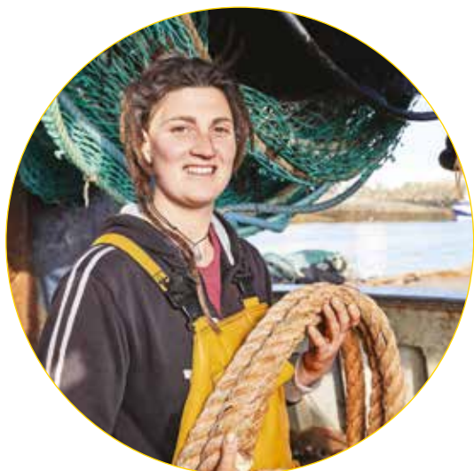
Matelote à la pêche

Les métiers présentés sont faits pour les personnes qui veulent travailler à l'extérieur. Les activités se déroulent en fonction de la météo. Il faut avoir une bonne condition physique.