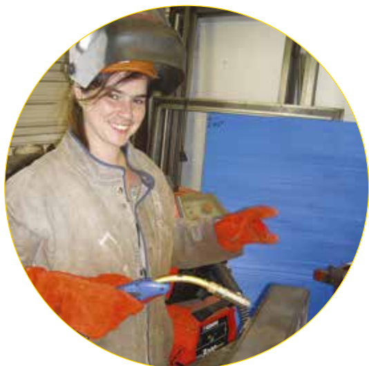
Soudeuse sur inox

Les métiers présentés font appel à la création et la fabrication (aliments, meubles, avions, maquettes, décors...). Ils demandent de l'habileté manuelle. Une bonne connaissance de la matière est aussi nécessaire.