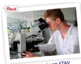
ma 1 re année en STAV

C'est la découverte de ces nouvelles matières qui nous a un peu bousculés en début d'année : devoirs sur la reconnaissance des végétaux, recherches sur les systèmes de production laitière en zootechnie. Pour mener ces travaux, il a fallu acquérir un nouveau vocabulaire "très technique"