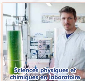
Sciences physiques et chimiques en laboratoire