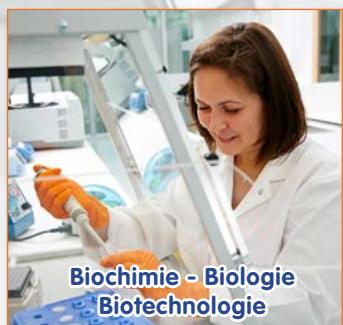
Biochimie - Biologie Biotechnologie