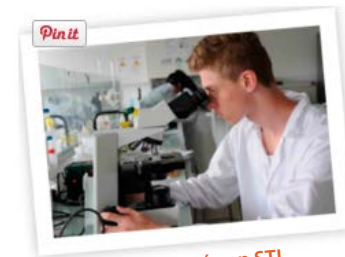
ma 1 re année en STL

Le bac STL forme des scientifiques rompus à la démarche expérimentale. Manipuler, observer, s'interroger, déduire... cette série s'adresse à des élèves intéressés par les manipulations autour de questions scientifiques d'actualité .