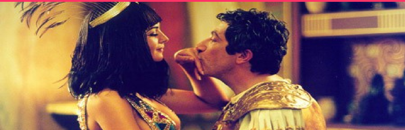
Savon lait d'ânesse

Le fameux nez de Cléopâtre est un sujet tabou pour elle, nul ne peut en parler devant elle, sinon elle le fera punir. En effet nombreux sont ceux qui ont fini dans l'enclos des crocodiles... Son nez la complexe terriblement. Or une analyse de la célèbre pensée y faisant référence montre que le choix du nez de la reine comme objet de séduction envers les chefs d'états romains, est d'avantage teinté de dérision, voir de mépris, que d'admiration de la part du philosophe.