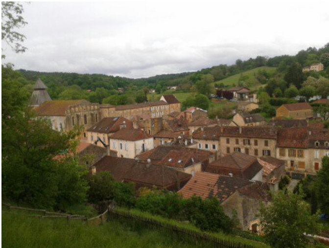
Vue du village de Cadouin