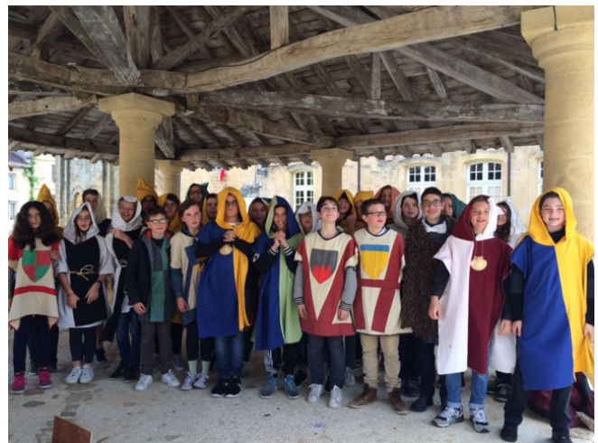
les élèves de 5 ème 1 déguisés sous la halle du village

Les animateurs de l'Association « Au fil du temps » ont effectué une visite guidée dans le village, l'église et le cloître pour étudier l'évolution du monastère, le mode de vie des moines et évoquer l'architecture romane et gothique. Les élèves ont revêtu des tenues médiévales pour mieux s'imprégner de l'Histoire.