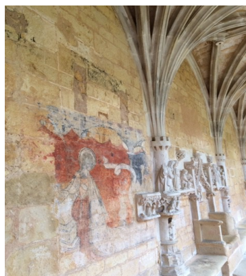
Cloître de Cadouin et détail d'une fresque

Puis, ils ont participé à des ateliers « fresques » et « bâtisseurs du Moyen Âge ».