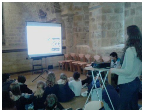
Diaporama sur les bâtisseurs du Moyen Âge

Puis, ils ont participé à des ateliers « fresques » et « bâtisseurs du Moyen Âge ».