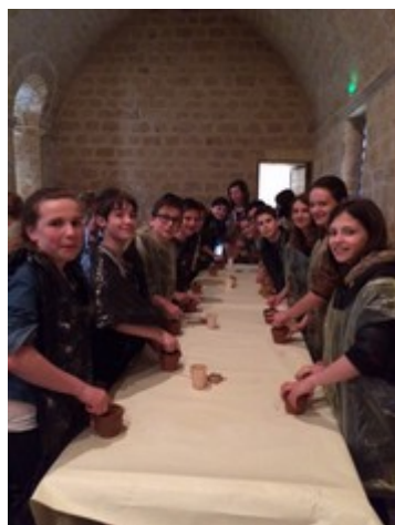
Les élèves de 5 ème 1 devant les pots servant à préparer les pigments pour les couleurs et l'enduit