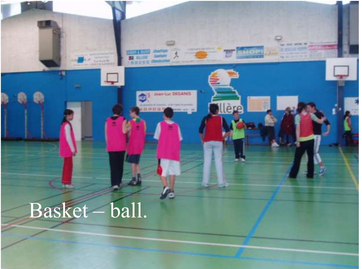
Basket – ball.