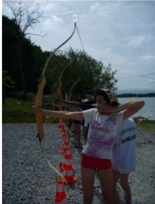
Tir à l'arc