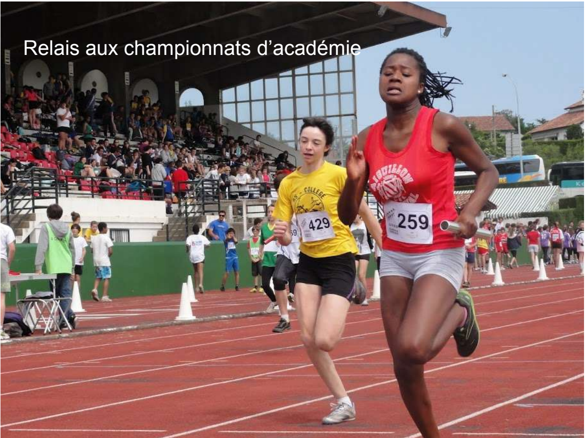
Relais aux championnats d'académie