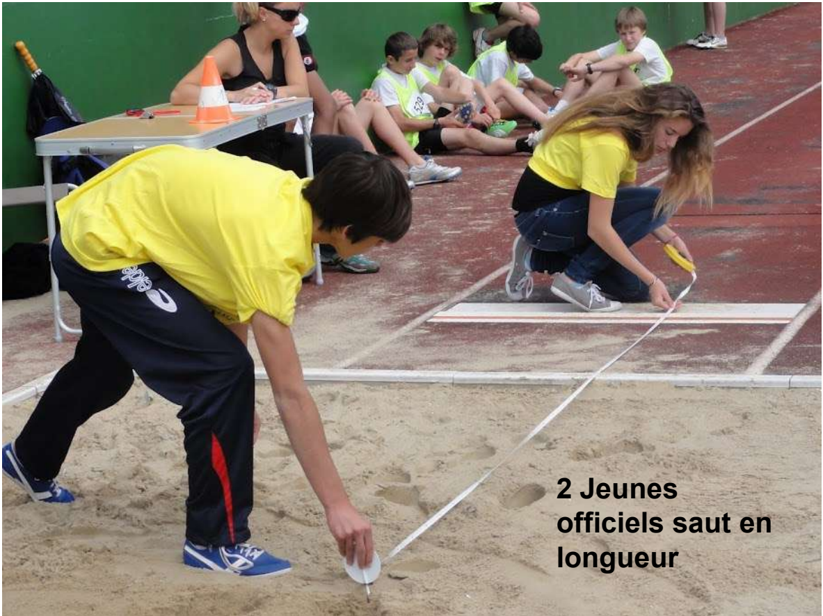
2 Jeunes officiels saut en longueur