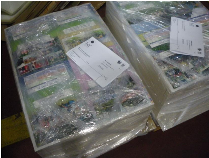
La classe de 3° 8

Quand le tirage est terminé il ne reste plus qu'à plier ou à couper et assembler les feuillets par agrafage ou, par collage. Les tirages achevés sont stockés dans un entrepôt avant d'être acheminés chez les clients.