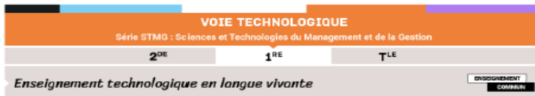
TABLEAU DE CORRESPONDANCE LVE ET MANAGEMENT : QUELQUES ILLUSTRATIONS

MINISTÈRE DE L'ÉDUCATION NATIONALE ET DE LA JEUNESSE