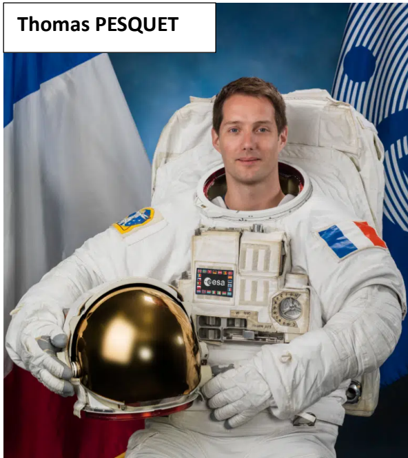
Énigme de lundi