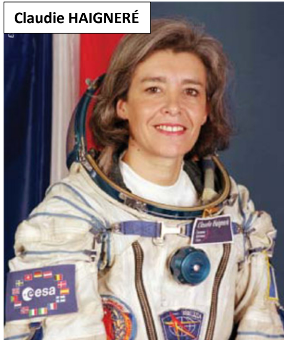
Énigme de mardi

Réponses aux énigmes posées pendant la semaine de la fête de la science au collège Émile ZOLA