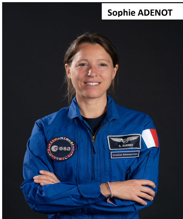
Énigme de vendredi