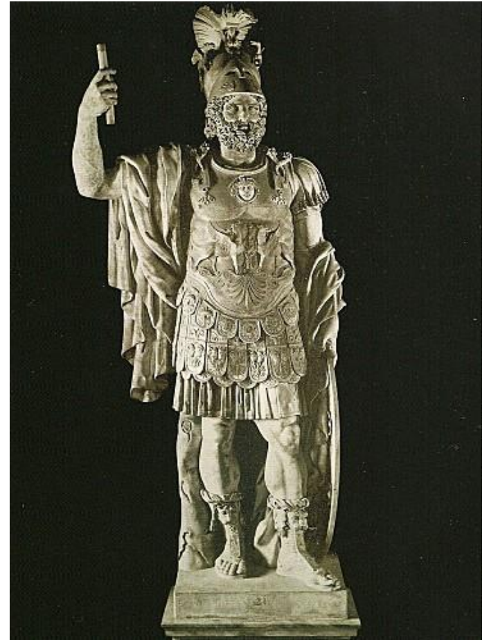
Statue de la divinité Mars

Il y aurait eu dans le temple une statue représentant la divinité Mars gardée par des prêtres dans la cella (partie du sanctuaire réservée à la statue du Dieu concerné et visible uniquement par les prêtres du temple).