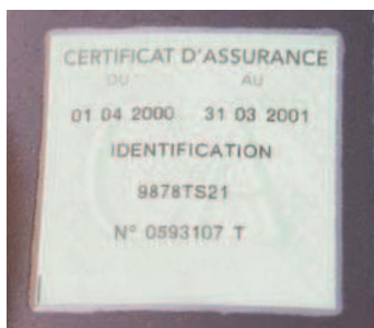
Le certificat d'assurance doit être collé sur le pare-brise de la voiture ou le garde-boue du deux roues.

Le verso du constat, que vous remplirez également avant de l'expédier, ne constitue qu'un complément d'information pour l'assurance. Il ne sera pas utilisé pour déterminer les responsabilités et il est donc inutile d'y faire figurer une version des faits différente de celle du recto.